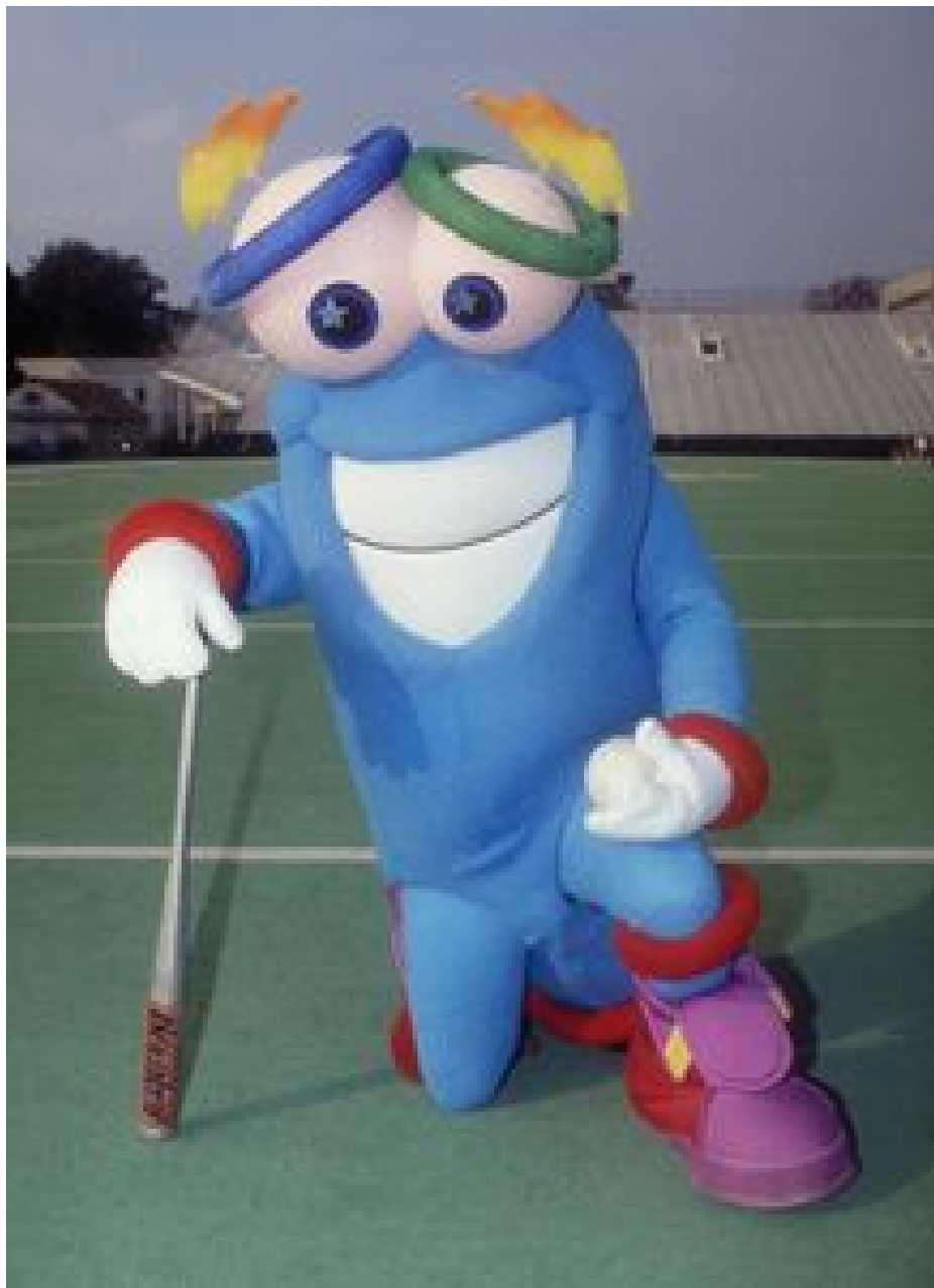
Олли, Сид и Милли (Сидней 2000)

Выдуманное существо, похожее на мультяшного человечка. Проект был не нарисован, а создан на компьютере. В течение долгого времени дизайнеры пытались привести его в порядочный вид: он получился синего цвета, с большими выразительными глазами, открытой улыбкой и хвостом с олимпийскими кольцами. На нем были надеты белые перчатки и огромные красные ботинки.