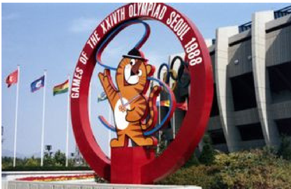
Щенок Коби (Барселона 1992)

Амурский тигр — герой корейской культуры. Чтобы не воспринимать животное свирепым и агрессивным, его сделали маленьким и добрым тигренком. Фигурку назвали Мальчик Тигр, что в переводе с корейского «Хо» — «тигр», а «дори» — «мальчик». На одно ухо была надета маленькая черная шапочка — атрибут национального костюма. Длинная изогнутая лента сделана в форме буквы «S» и означала «Сеул».